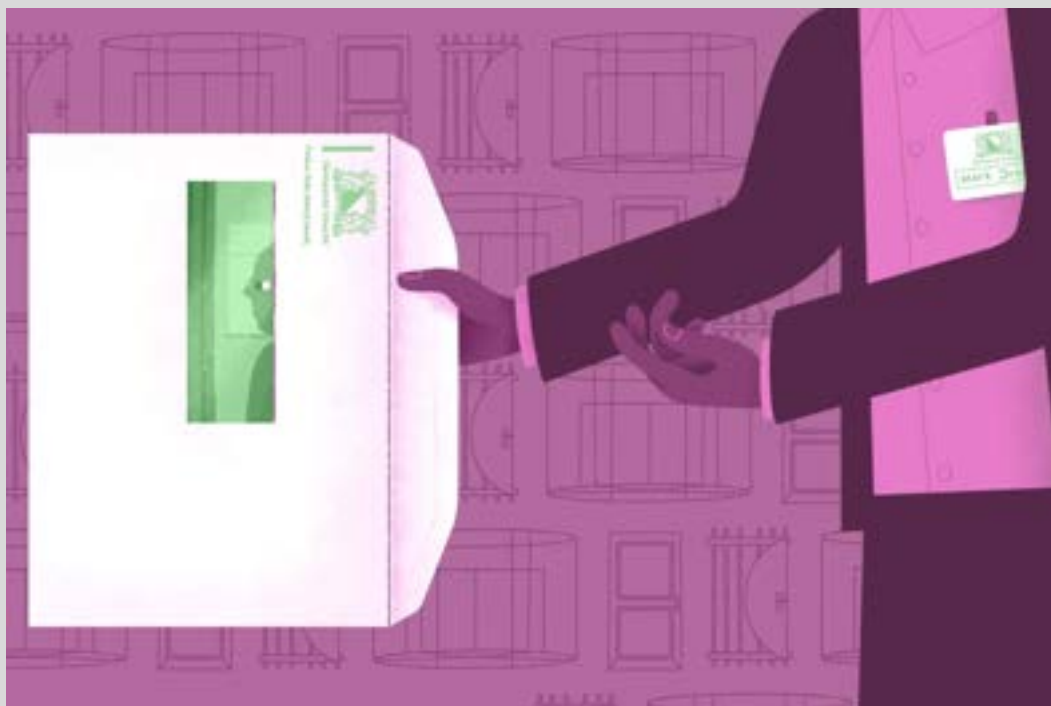
Illustratie door Cliff van Thillo (voor De Correspondent)

Bron: De Correspondent auteur Cor Lash - Overheid