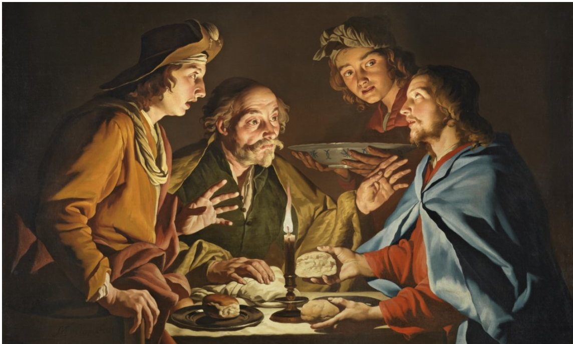
Matthias Stom, De Emmaüsgangers

NB: welkom om in gesprek te gaan, of: samen te gaan doen!!!!