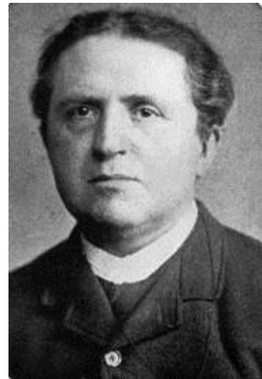
Ds. Abraham Kuyper

in het door hem opgerichte dagblad De Standaard voor het terugkeren van de kerk 'in het gereformeerde spoor der vaderen'. Het kerkbestuur liet zich daar verder weinig aan gelegen liggen. In 1879 richtte de daadkrachtige Kuyper een politieke partij op, de ARP (Antirevolutionaire Partij) en in 1880 werd de Vrije Universiteit gesticht, waar predikanten opgeleid werden buiten de officiële door de Nederlands Hervormde kerk aangewezen universiteiten. In 1886 kwam het in Amsterdam tot een definitieve breuk tussen Kuyper en de Nederlands Hervormde kerk.