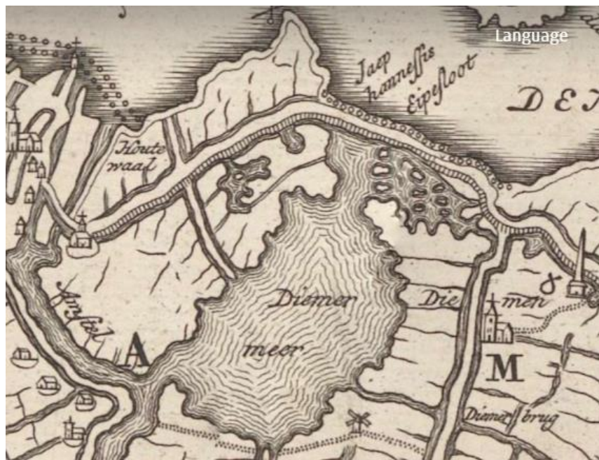
Figuur 2 Diemermeer

De voorgeschiedenis in vogelvlucht. Het christendom arriveerde in onze streken, aan de rand van het voormalig Romeinse Rijk en aan het begin van zompige moerassen, vooral vanaf de achtste eeuw. De Watergraafsmeer – eerder de Diemermeer - bestond toen natuurlijk nog niet. De Diemermeer was oorspronkelijk het gevolg van een doorbraak rond 1200 van de Sint Anthonisdijk (de tegenwoordige Zeedijk-Zeeburgerdijk-